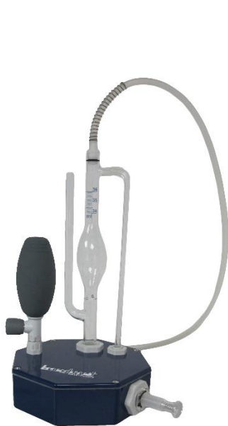
Bubblemeter 34 – 36 ml