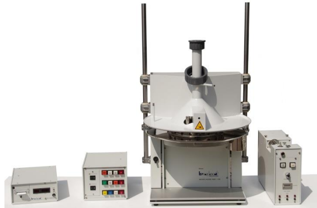
RM20/CSR (mit Haube) nach der Überholung

Noch immer kommt die RM20/CS mitsamt dem RGA-System, der Pneumatikeinheit inkl. Canada Intense sowie dem Zugzahldrucker in vielen Rauchlaboren weltweit, als verlässlich arbeitende Rauchmaschine, zum Einsatz. Um diesen Einsatz auch weiterhin sicherzustellen, bieten wir die Überholung der RM20/CS sowie der dazugehörigen Komponenten an. Dieser Service umfasst: