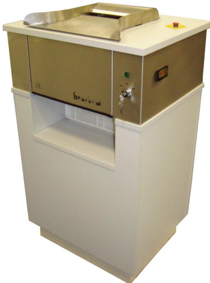
TCB-02 Tabakschneider (freistehende Variante)

Der TCB Tabakschneider wurde für den Gebrauch im Labor entwickelt und dient dem unkomplizierten und schnellen Schneiden von Tabakblättern. Die Standardschnittbreite beträgt 0,75 mm (min. 0,6 mm) und kann durch das Austauschen der Schneidwalzen und der dazugehörigen Kämmen verändert werden.